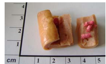
Saitenwürstchen, gefüllt mit Rodentizid (Wirkstoff: Brodifacoum (Cumarinderivat))