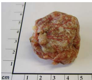
Salamischeiben, gefüllt mit Natronlauge-Plätzchen (durch Luftfeuchtigkeit schon leicht zerflossen)