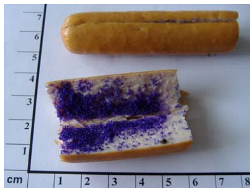
Saitenwürstchen, gefüllt mit Insektizid (Wirkstoff: Carbofuran)